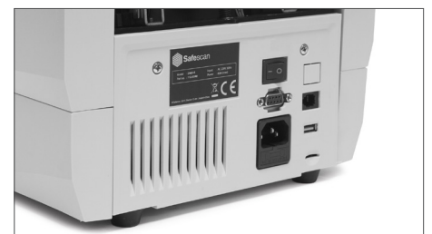
Puertos de actualización de divisas, conexión con Impresora térmica