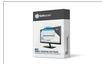
Safescan MCS Software Art. no: 131-0500