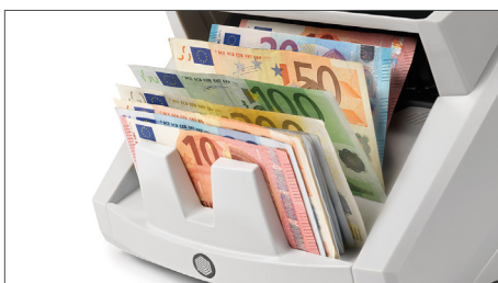
Conteo de valor para billetes de euro mezclados