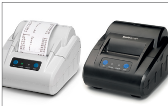
Safescan TP-230 Impresora térmica Art. no: 134-0475 gris Art. no: 134-0535 negro