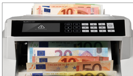
Alerta visual y auditiva cuando se detecta un billete sospechoso