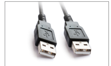
Safescan USB cable de actualización Art. no: 124-0458